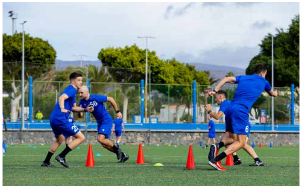
Les arbitres et assistants d'élite se sont préparés à Gran Canaria pour le match retour.