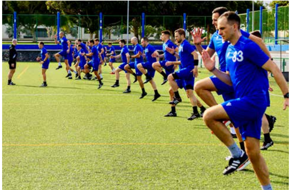
Les arbitres, hommes et femmes, ont bénéficié d'un entraînement varié.

C'est encore un peu surréaliste. Chaque week-end, j'ai observé et analysé les meilleurs arbitres de Suisse pour apprendre d'eux. Aujourd'hui, je suis ici, invité en tant qu'arbitre «talent» de la Promotion League, au même endroit qu'eux, prêt à vivre leur quotidien, à ressentir de l'intérieur ce que cela signifie d'être un arbitre d'élite.