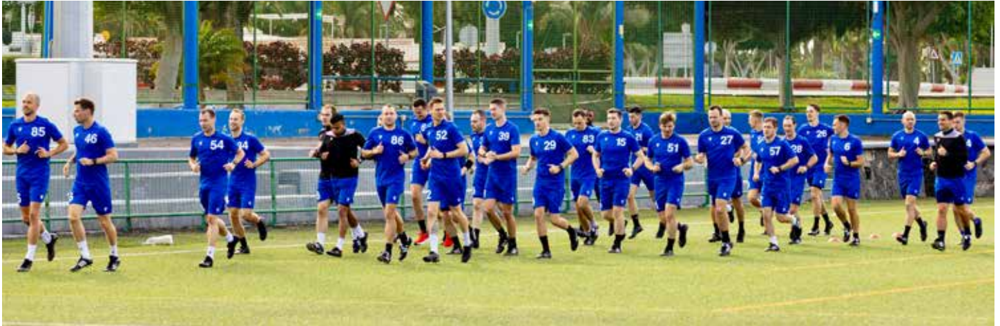
Préparation physique.