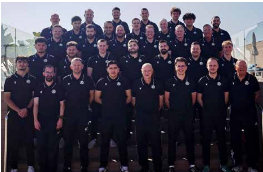
Die Teilnehmenden des neunten Trainingslagers der Region NWS versammeln sich zum Gruppenfoto.