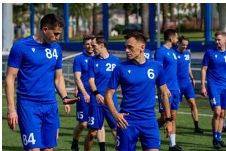
Pleine concentration.