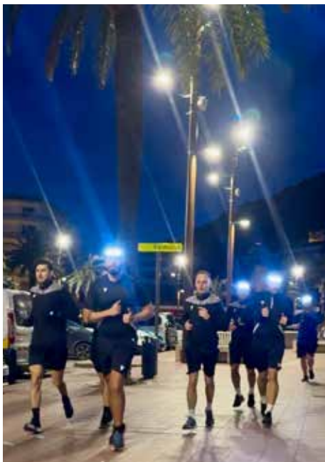
Morgendliches Footing durch Lloret De Mar.