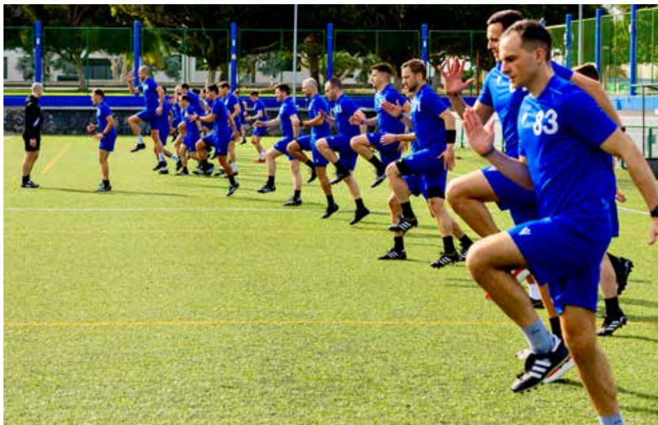
Sowohl Schiedsrichter als auch Schiedsrichterinnen profitierten von einem vielseitigen Training.

Schweizerischer Fussballverband, Referee Department