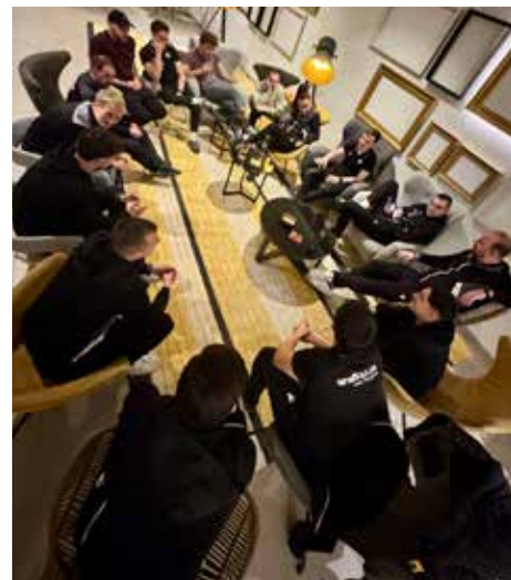
Gemeinsames Kartenspiel am Abend.

Aber auch die Kameradschaft spielte eine grosse Rolle. Da zum ersten Mal Schiedsrichter aus der ganzen Schweiz am Camp teilnehmen konnten, war es einfach, neue Kontakte zu knüpfen und Netzwerke über die eigene Region hinaus aufzubauen. Gemeinsame Aktivitäten am Abend förderten den Teamgeist