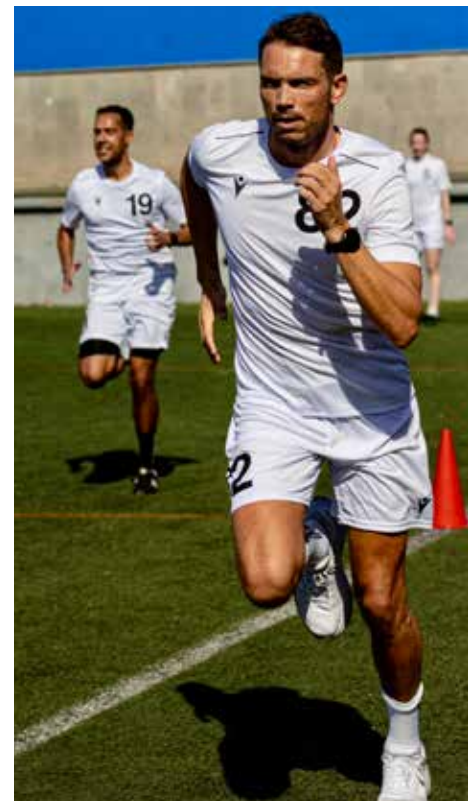
Voller Einsatz auch bei Top-Referee Sandro Schärer.

Aber das Adrenalin macht alles wieder wett. Die Tage bestehen auch aus Kursen und Workshops: Videoanalyse, Umgang