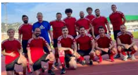
Wieder eine Sporeinheit geschafft!