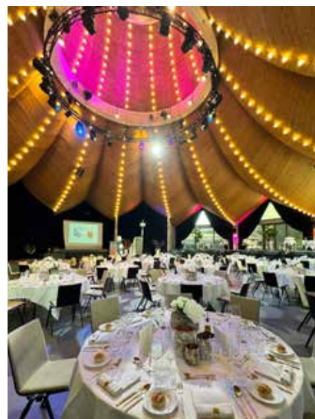
Feiern in einem festlichen Rahmen.

denten der Region Zürich, Giuseppe «Peppi» Monserrato und einer kurzen Rückblende auf die 100-jährige