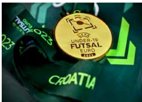
Finalmedaille als Erinnerung

Für mich war dieses UEFA-Endrunden-Turnier sehr speziell. Einerseits darum, weil ich im Heimatland meiner Eltern ein Endturnier bestreiten durfte, andererseits weil ich ein gesundheitlich