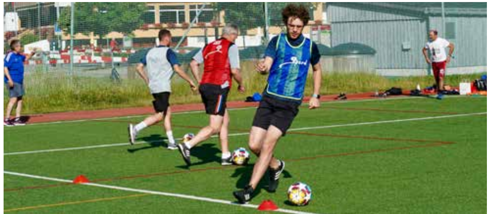
Der FIFA-Lauf um den See erfreut sich stets grosser Beliebtheit (Foto oben), doch die Teilnehmenden schätzen es auch, wenn sie im Trainingsprogramm mit dem Fussball arbeiten können (Foto unten).