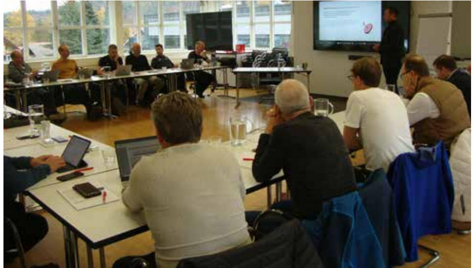
L'échange mutuel est très important et précieux.