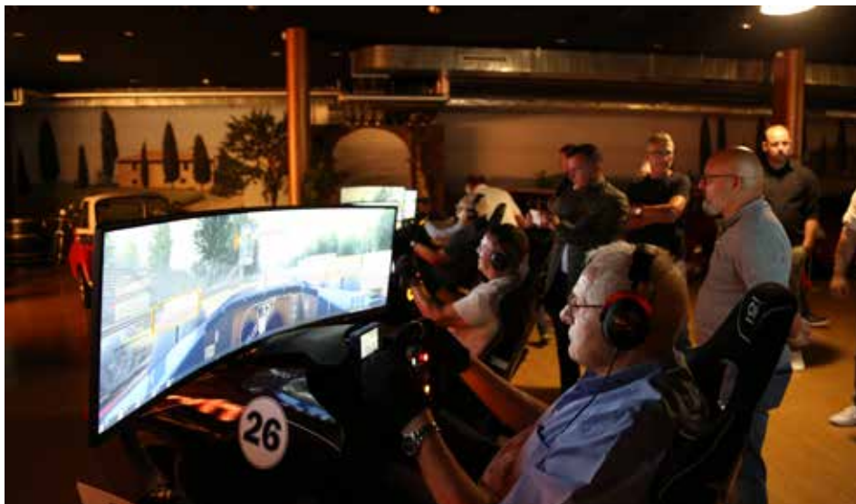
Am Steuerknüppel des Simulators ans Limit gehen: Dieser Herausforderung stellten sich vorwiegend die männlichen Teilnehmenden am Programm der Delegiertenversammlung.