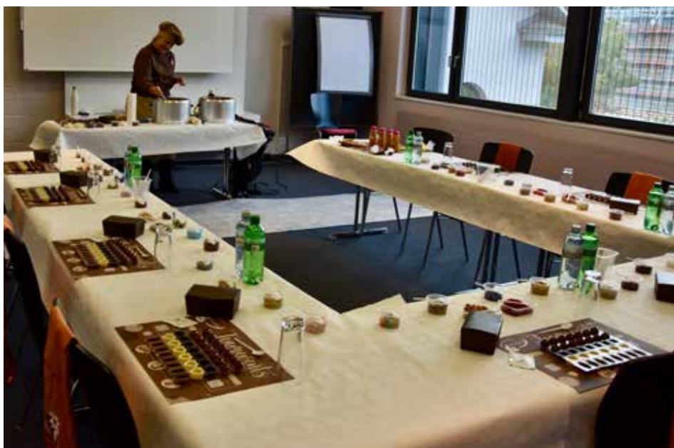
Die Feinheiten in der Herstellung von Schokoladenprodukten gab es in einem Workshop zu erfahren.

Kontrolle hatte und auch rettende Manöver keine Wirkung zeigten.