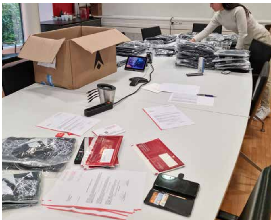
Abpackaktion für die Wettbewerbsgewinnerinnen und Wettbewerbsgewinner.

In der Zwischenzeit konnte das Referee Department des SFV alle Rückmeldungen verarbeiten. Im Rahmen dieser Aktion wurden 90 Pakete mit Macron-Ma-