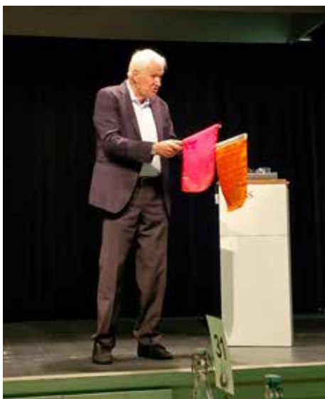
Auch die Original-Linienrichter-Fahnen waren da!

Den wirklichen Kultstatus erhielt Dienst jedoch wegen seines Einsatzes im WM-