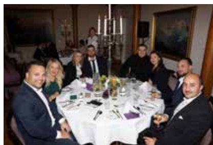
Lächeln für den Fotografen.