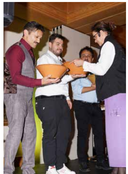
Selbstversuch in traditionellen Bräuchen.