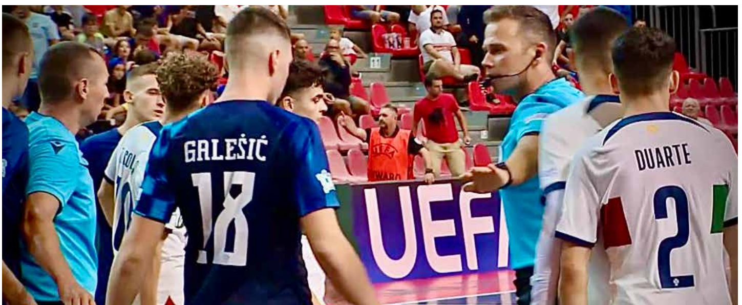
Es laufen die letzten Sekunden in der Begegnung zwischen Kroatien und Portugal.