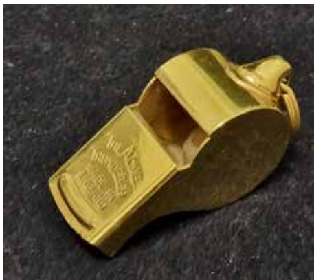
Mit dieser Pfeife arbitrierte Gottfried «Gotti» Dienst den WM-Final von 1966.