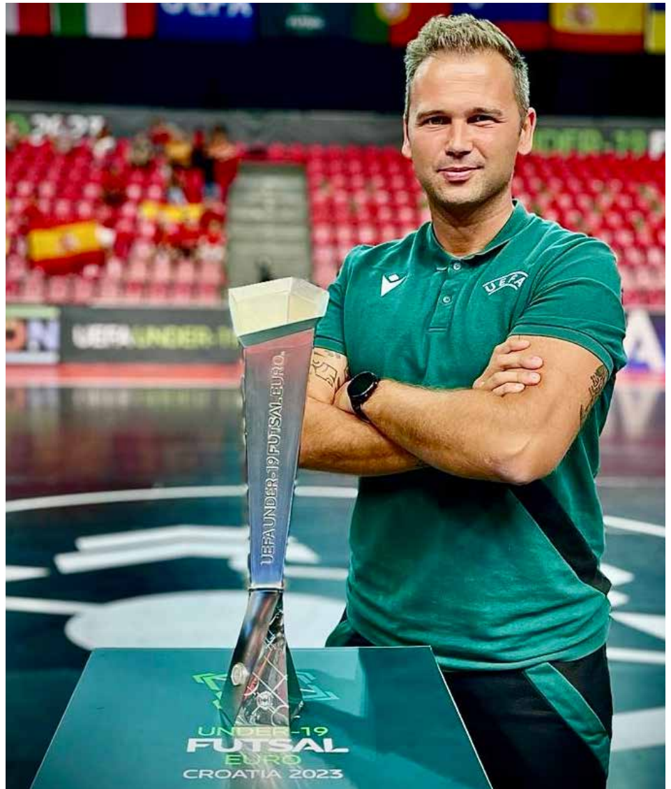
Fototermin vor dem Anpfiff zum Finalspiel zwischen Spanien und Portugal.

Für mich stand eine Achterbahn der Gefühle an. Irgendwie surreal nach all den Geschehnissen. Das Finale war ein sehr schönes Erlebnis, auch wenn das Spiel nicht einfach zu leiten war. Dieser Moment wird immer in meiner Erinnerung und unvergesslich bleiben. Ich danke dem SFV und all den Menschen, die mich in meiner Laufbahn unterstützt haben und an mich glaubten.»