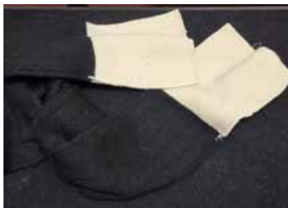
Die Stulpen des WM-Final-Referees.