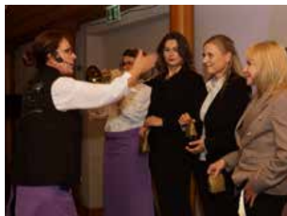
Auch Gäste wurden Teil des Unterhaltungsprogramms.