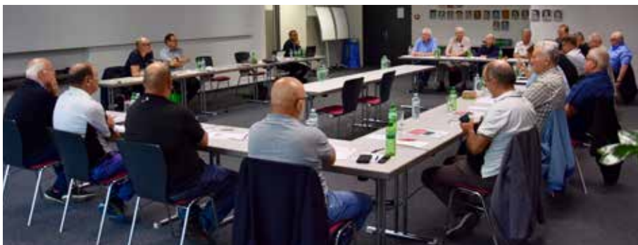
Die Vertreterinnen und Vertreter der SSV-Regionen bei der Beratung der Geschäfte.