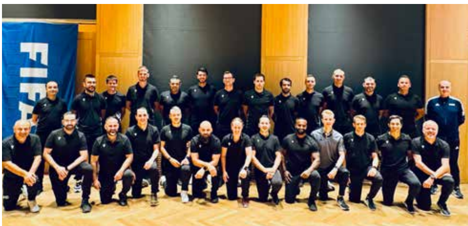
Die am Kurs teilnehmenden Futsal-Elite-Referees aus der Schweiz versammeln sich zum Gruppenbild.