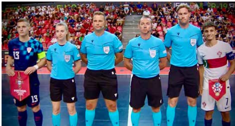
Vor dem Spiel zwischen Kroatien und Portugal.

schwieriges Jahr zu überstehen hatte. Mir war lange nicht klar, ob ich jemals wieder auf dem Platz stehen würde, geschweige denn ein solches Aufgebot zu erhalten. Viel harte Arbeit, ein starkes familiäres Umfeld und gute Freunde brachten mir die Energie, wieder an mich und meine Träume zu glauben.