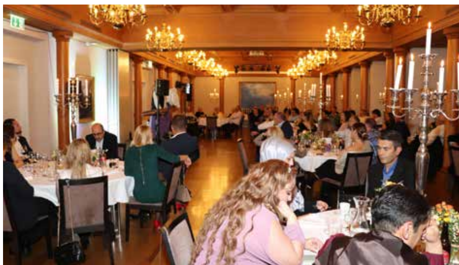
Feiern in würdiger Atmosphäre im Schloss Laufen.