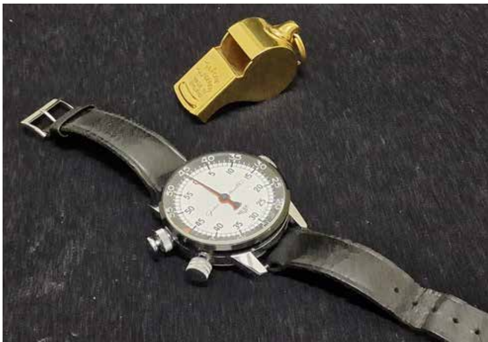
Uhr und Pfeife - weitere Gegenstände aus dem WM-Final.

Die Redaktion des «Schweizer Schiedsrichter» bedankt sich bei der Stiftung Ehrentor, welche die Ausrüstungsgegenstände von WM-Referee Gotti Dienst zur kurzzeitigen Verfügung gestellt hat.