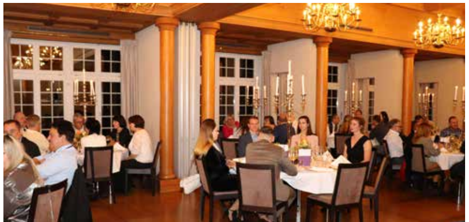
Im Zentrum des Abends stand das gediegene Gala-Dinner.