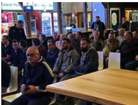
Rund 70 Interessierte verfolgten das Podiumsgespräch.

Wichtig erschien allen Diskussionsteilnehmenden, dass neue Schiedsrichte-