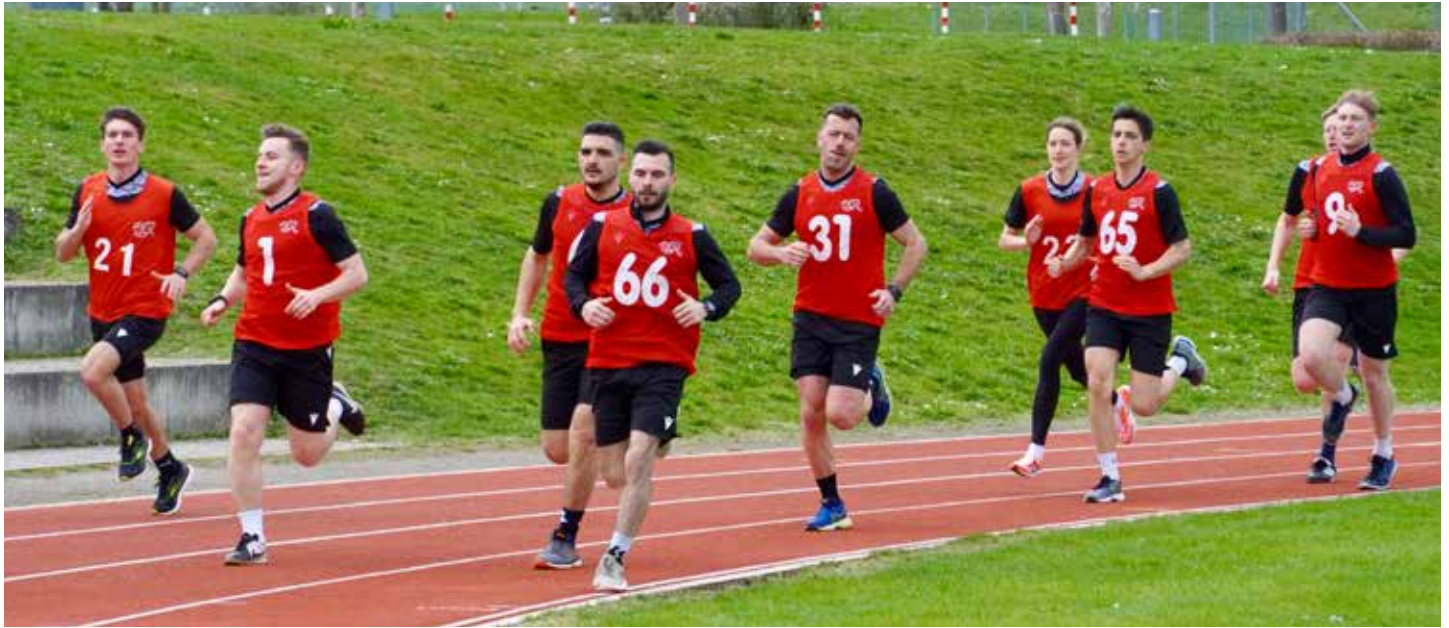
Kurs in Murten.