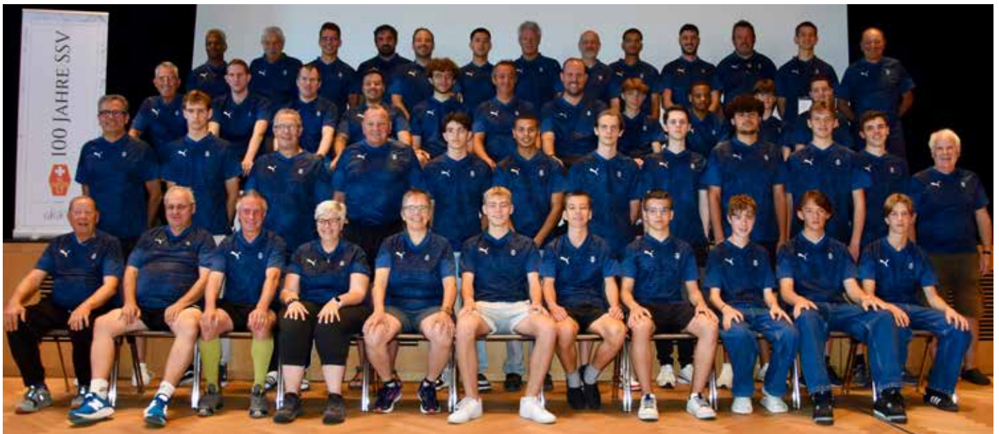
Die Teilnehmenden der 49. SSV-Sportwoche vereint zum Gruppenfoto.

Marcel Vollenweider Redaktor deutschsprachiger Teil