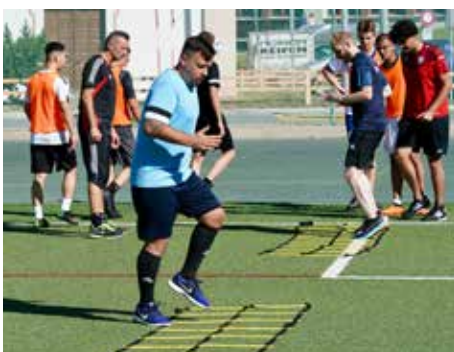
Intensives Arbeiten lohnt sich.