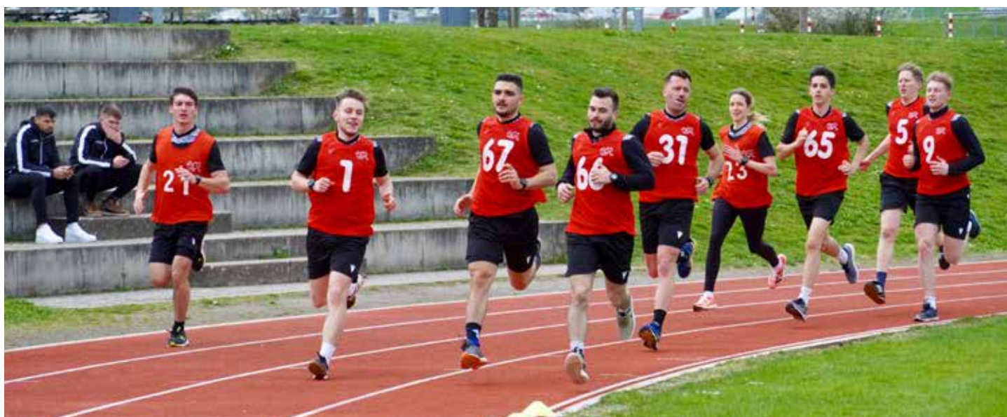
Les arbitres de l'Academy pendant le test physique.

Jusqu'à présent, la qualification se faisait également au sein de l'Academy. En raison de la nouvelle structure, cette évaluation de qualification a été suppri-