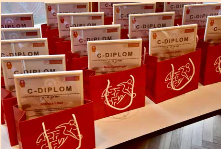
Bis auf einen Teilnehmenden meisterten die Schiedsrichter im Grundkurs die Herausforderungen.

Die Woche wurde für uns vom Grundkurs mit der Brevetierung abgeschlossen. Abschliessend lässt sich sagen, dass es eine grossartige Woche war und es sich lohnt hat, den Grundkurs innerhalb der 49. Sportwoche des SSV in der Lenzerheide zu absolvieren. Ich kann dies allen zukünftigen Schiedsrichter-Kandidaten wärmstens empfehlen.