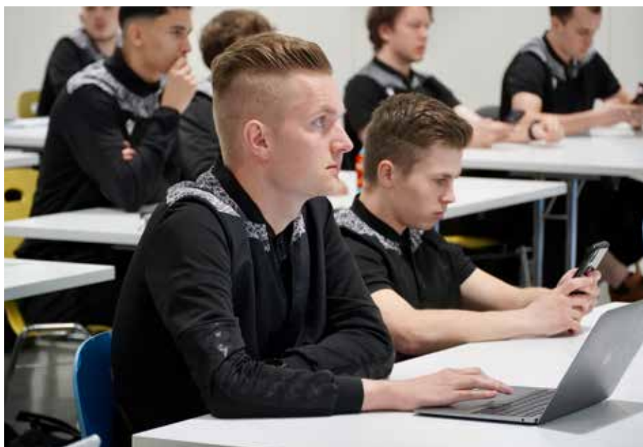
Les assistants de l'Academy pendant une leçon théorique.

Lors des engagements sur le terrain, les ARB et AA de l'Academy ont pu profiter du savoir-faire acquis en théorie. Afin de tirer également les bonnes conclusions et les bons enseignements de la pratique, nos coaches Academy ont accompagné les actifs lors de nombreuses directions de matchs. C'est jus-