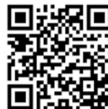
IFAB-Ausführungen zu allen Regeländerungen.

Eine wichtige Regelmodifikation betrifft ein strafbares Offside, wenn der Ball vom Gegner kommt