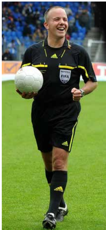
Sascha Kever im Einsatz als Referee.