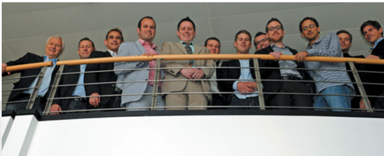
Die diplomierten Neuinstruktoren der deutschsprachigen Schweiz posieren mit ihren Ausbildnern im Haus des Schweizer Fussballs.