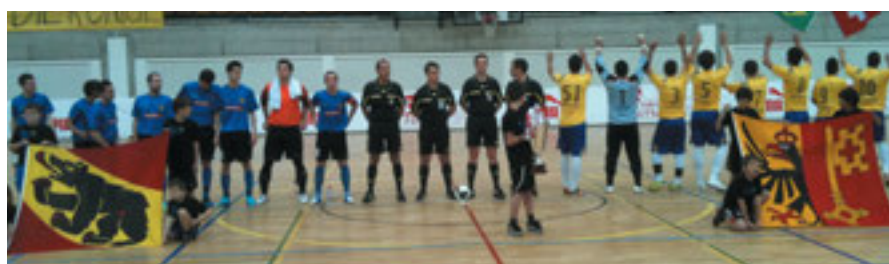
Finalissima Campionato Svizzero Serie A.

Sullo slancio della positività che si è creata attorno a questa nuova disciplina in Ticino ebbene la Federazione Ticinese di Calcio si sta