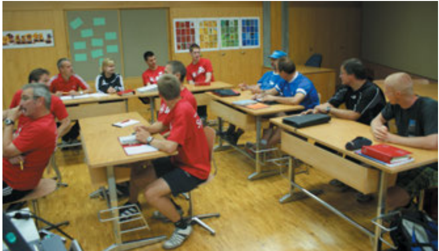
Auf der Lenzerheide wird nicht nur Theorie gepaukt - es wird auch viel Sport getrieben.