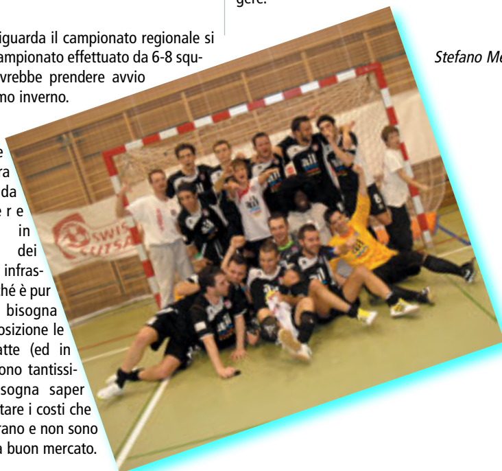
Lugano Pro Futsal che festeggia la promozione in LNA.

Chiaramente ci sono ancora dei nodi da sciogliere soprattutto in previsione dei costi e delle infrastrutture, perché è pur vero che bisogna avere a disposizione le palestre adatte (ed in Ticino non sono tantissime), ma bisogna saper anche affrontare i costi che queste generano e non sono certamente a buon mercato.