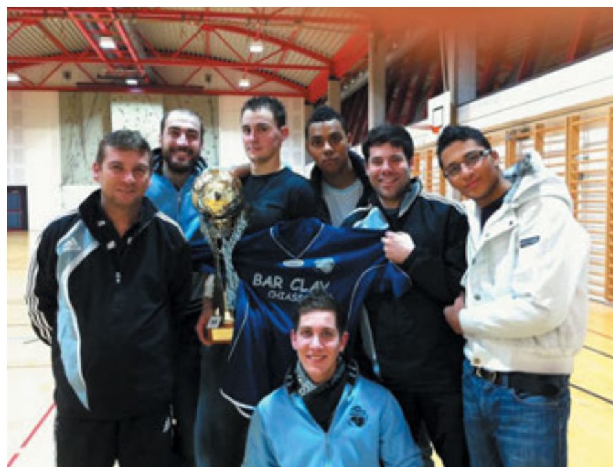
Squadra vincitrice del torneo.