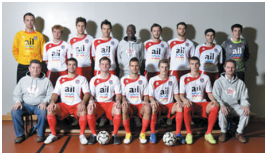
Lugano Pro Futsal 2010/2011.

impegnando per creare un nuovo campionato regionale (ossia una prima lega). Discorso ancora aperto per quanto riguarda una squadra di Lega Nazionale B dove vi è ancora la possibilità di iscrivere una nuova squadra ticinese, passo che sarebbe auspicabile per dare ancora maggiore attrattività a questa attività sportiva molto tecnica. Fondamentale sarebbe l'iscrizione di una nuova società così da poter sorreggere e dare man forte all'attuale unica squadra presente in Lega Nazionale rappresentata dal Lugano.